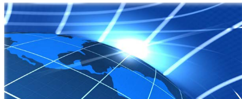
Managed Print Services Landscape, 2015

Лидер европейского рынка услуг по управлению документооборотом