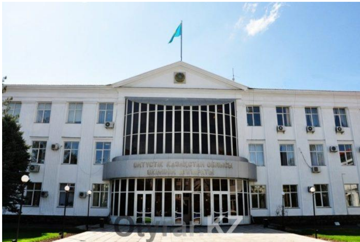
250 местные органы управления