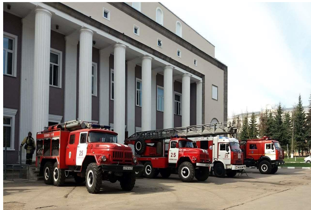
20 аварийных служб